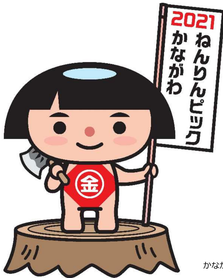
かながわキンタロウ