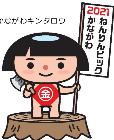
かながわキンタロウ

大人から子供まで、広く親しまれる神奈川県PRキャラクター「かながわキンタロウ」を「ねんりんピックかながわ2021」のマスコットキャラクターに採用しました。